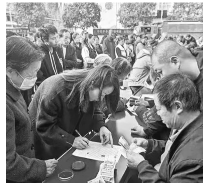
金新社区2024年村集体经济分红大会现场。

做好栗峪河水污染治理和巡查工作。金堆镇政府在资金困难的情况下，完成5个矿洞的深度封堵，治理历史遗留废