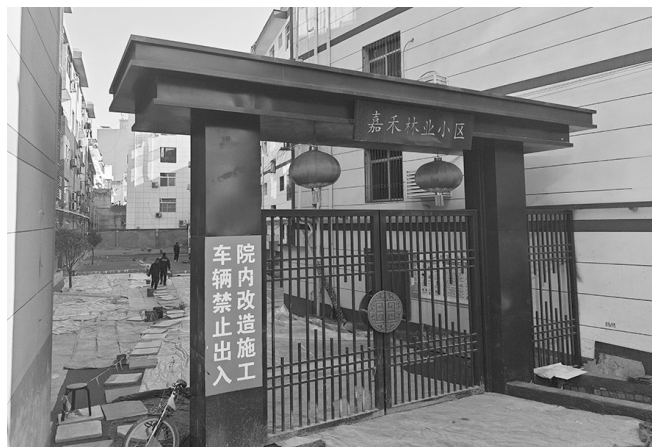
镇安县嘉禾林业小区出入口道路进行改造。

如今,走进镇安县城,高楼鳞次栉比,建筑错落有致,道路宽敞整洁,公园景色宜人,城市面貌焕然一新。一幅天蓝、水清、地绿、宜居的生态城市美好画卷,正在镇安这片沃土上徐徐展开。◎