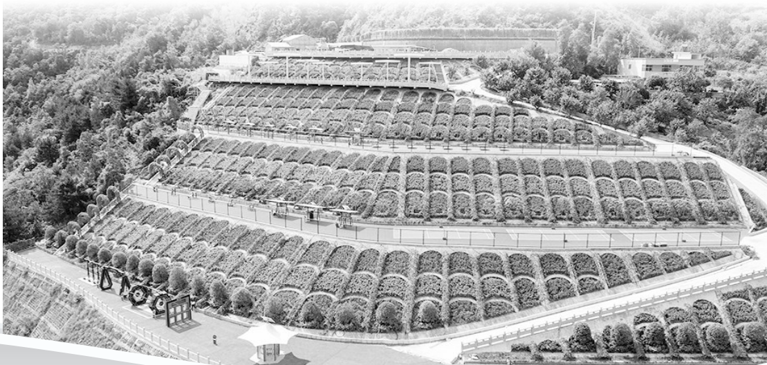
商洛市金台山体育运动公园。

近年来,镇安县锚定“秦岭最佳康养会客厅”目标定位,围绕“好房子、好小区、好社区、好城区”四好城市建设目标,以城市更新为主线,补齐县城建设短板弱项,全面提升县城品质和承载力,增强县城综合服务能力和服务水平,助推县域经济社会高质量发展。