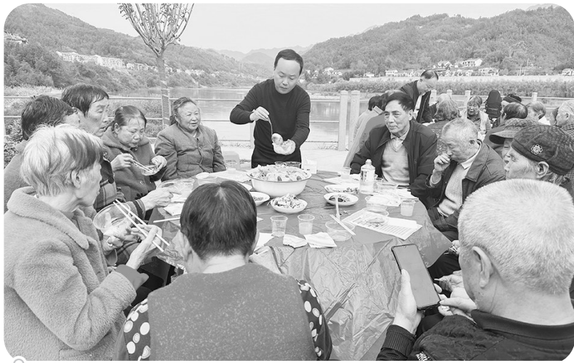
10月23日,汉阴县汉阳镇开展“弘扬敬老传统,传承地方文化”主题活动。

质量发展。要围绕时间节点要求,采取强有力措施,切实解决信息化建设工作的重点难点,确保监管信息化建设落地见效。要严格执行项目建设相关规定,加强资金使用管理和监督,坚决守好廉洁从政底线。要压紧压实责任,强化工程施工人员安全管理,杜绝安全生产事故发生。