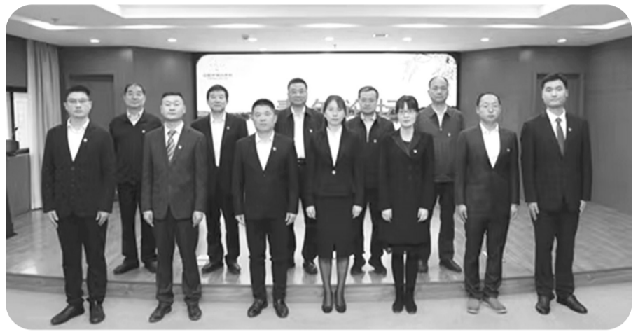
省供销社首届“青年论坛”活动上，参会领导和青年干部代表合影。

省供销合作机关全体人员、陕西供销企业集团班子成员、陕西供销电子商务集团班子成员，以及系统各单位各部门40岁以下青年干部参加了本届“青年论坛”。